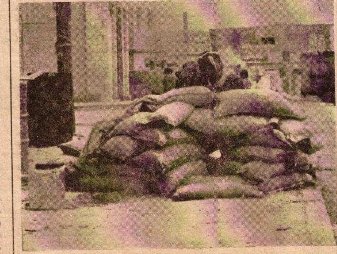
الميليشيا . . . ستبقى دائما درعا لجماهيرنا . . . وسندا للثورة

وقال ان اضراب المحامين وعدم قبولهم المرافعة أمام محاكم العدو هي من أبرز أشكال المقاومة السلمية في المناطق العربية المحتلة التي ما زالت رغم تهديدات وأساليب العدو للضغط والتشكيل بالمواطنين العرب .