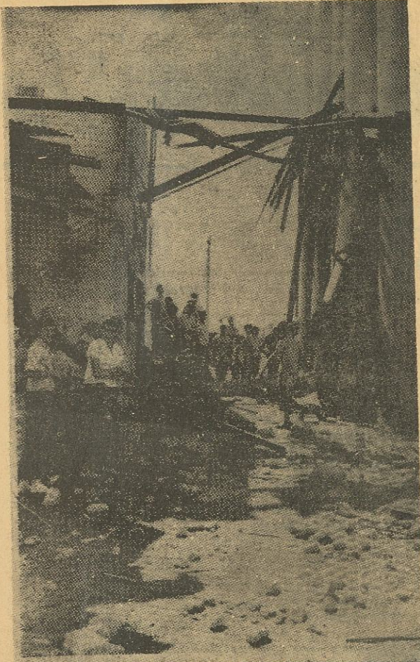
سكان مستعمرة « ماعوز حاييم » في حالة ذعر على اثر نسف مخزن التغذية

● لقد تعلمنا من الحرمان معنى العدل وقيمة وجوده ، وتعلمنا من البؤس والاذلال كيف نكون أوفياء لاولادنا واجيالنا الصاعدة حريصين على مستقبلهم .